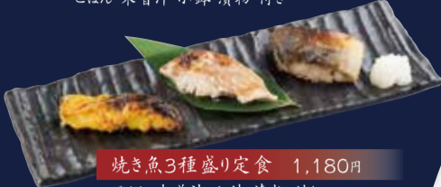
焼き魚3種盛り定食 1,180円 ごはん・味噌汁・小鉢・漬物 付き