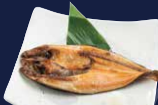
ほっけ塩焼き定食 1,080円 ごはん・味噌汁・小鉢・漬物 付き