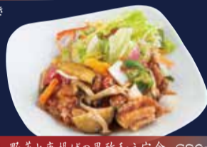
野菜と唐揚げの黒酢和え定食 980円 ごはん・味噌汁・小鉢・漬物 付き