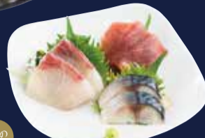
木曜のお刺身3点盛り定食 1,080円 ごはん・味噌汁・小鉢・漬物 付き