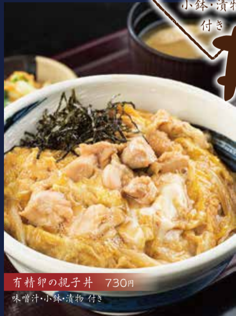
有精卵の親子丼 730円 味噌汁・小鉢・漬物 付き