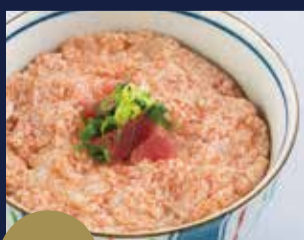
+380円 ねぎとろごはん