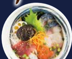
海鮮丼 1,280円 味噌汁・小鉢・漬物 付き 酢飯