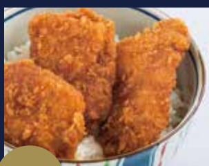
+280円 たれカツごはん