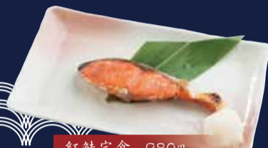
紅鮭定食 980円 ごはん・味噌汁・小鉢・漬物 付き