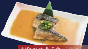
さばの味噌煮定食 890円 ごはん・味噌汁・小鉢・漬物 付き