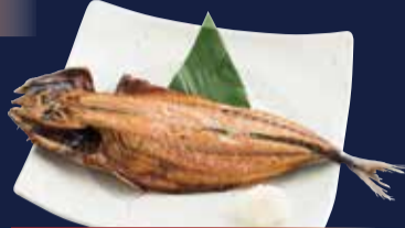
さばの一夜干し定食 980円 ごはん・味噌汁・小鉢・漬物 付き