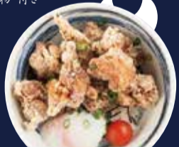
山盛り唐揚げ丼 880円 味噌汁・小鉢・漬物 付き