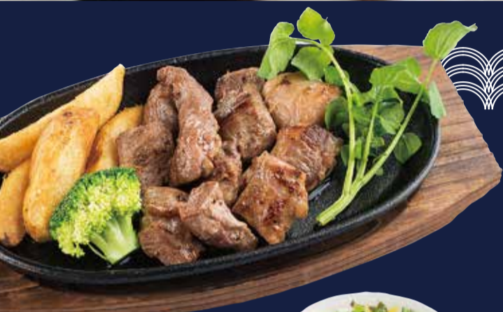
豚ハラミ定食 1,080円 ごはん・味噌汁・小鉢・漬物 付き