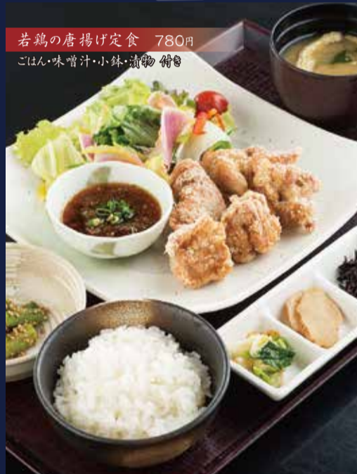
若鶏の唐揚げ定食 780円 ごはん・味噌汁・小鉢・漬物 付き