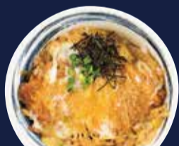
有精卵のカツ丼 980円 味噌汁・小鉢・漬物 付き