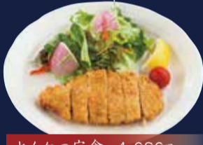
とんかつ定食 1,080円 ごはん・味噌汁・小鉢・漬物 付き