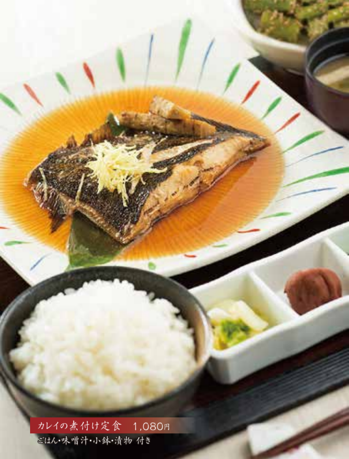
カレイの煮付け定食 1,080円 ごはん・味噌汁・小鉢・漬物 付き