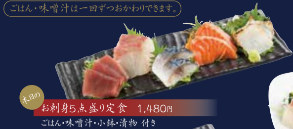
木曜のお刺身5点盛り定食 1,480円 ごはん・味噌汁・小鉢・漬物 付き