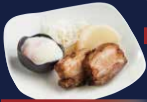
もち豚角煮定食 1,380円 ごはん・味噌汁・小鉢・漬物 付き