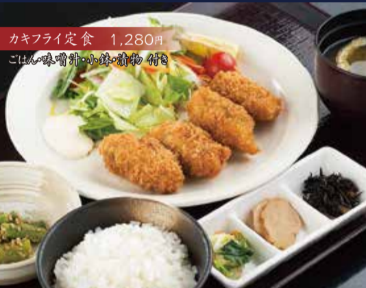
カキフライ定食 1,280円 ごはん・味噌汁・小鉢・漬物 付き