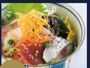
+380円 海鮮ごはん ※海鮮の内容は季節によって異なる場合がございます